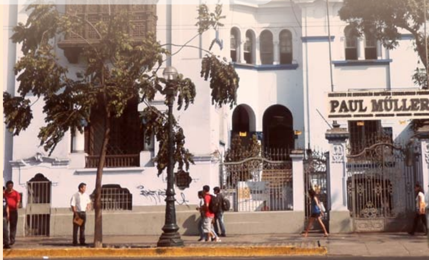
Local de Paseo Colón está dentro de zona histórica de Lima.