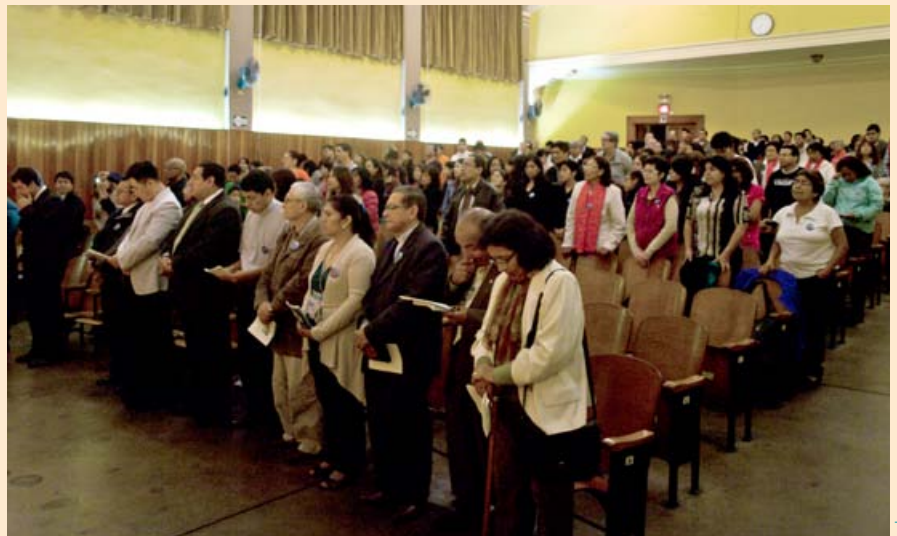
Culto en el auditorio del colegio María Alvarado con buena asistencia.